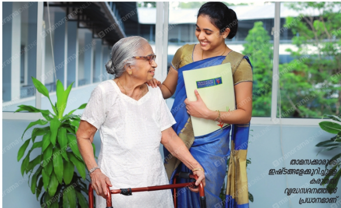
താമസക്കാരുടെ ഇഷ്ടങ്ങളേക്കുറിച്ച് കർമ്മി വ്യവസ്ഥനയന്തി പ്രധാനമാണ്

മണിയടിക്കുമ്പോൾ കഴിക്കണം, കൃത്യസമയത്ത് ഉറങ്ങണം എന്ന മട്ടി